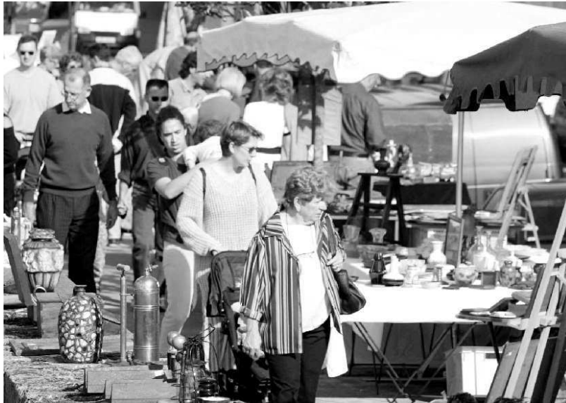
Choix. Avec cent stands proposés, chaque client devrait trouver l'objet de ses rêves

Prix discutés. Sur la surface de 5 000 m 2 offerte par l'esplanade